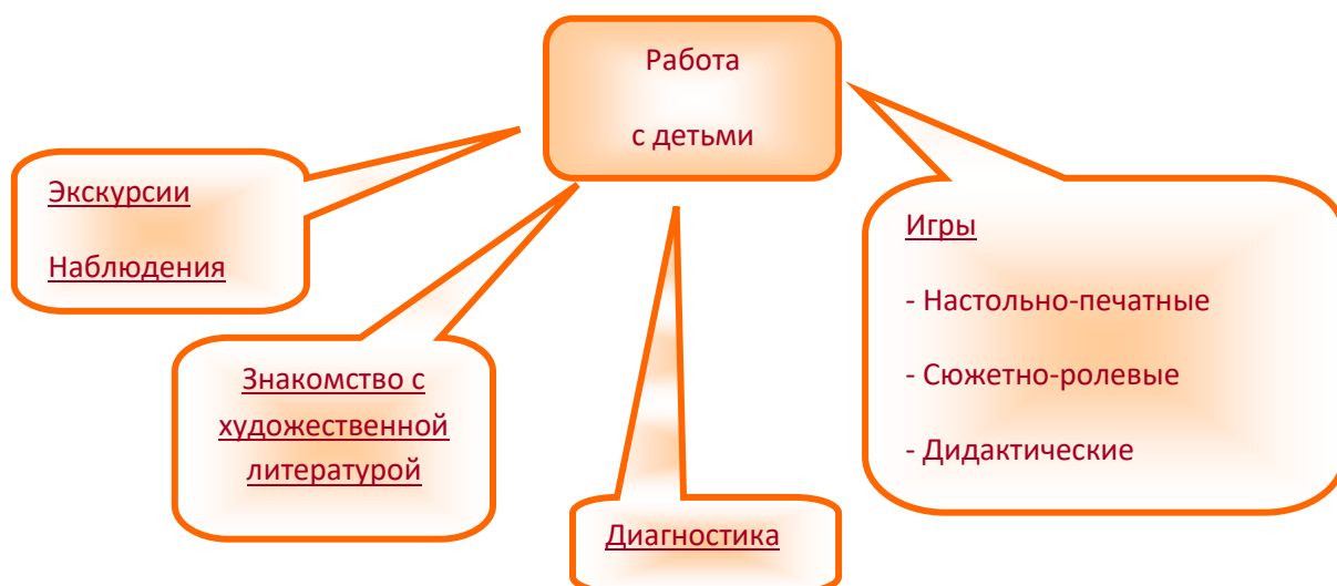
Рис.1 Формы работы с детьми по обучению безопасному поведению на дороге